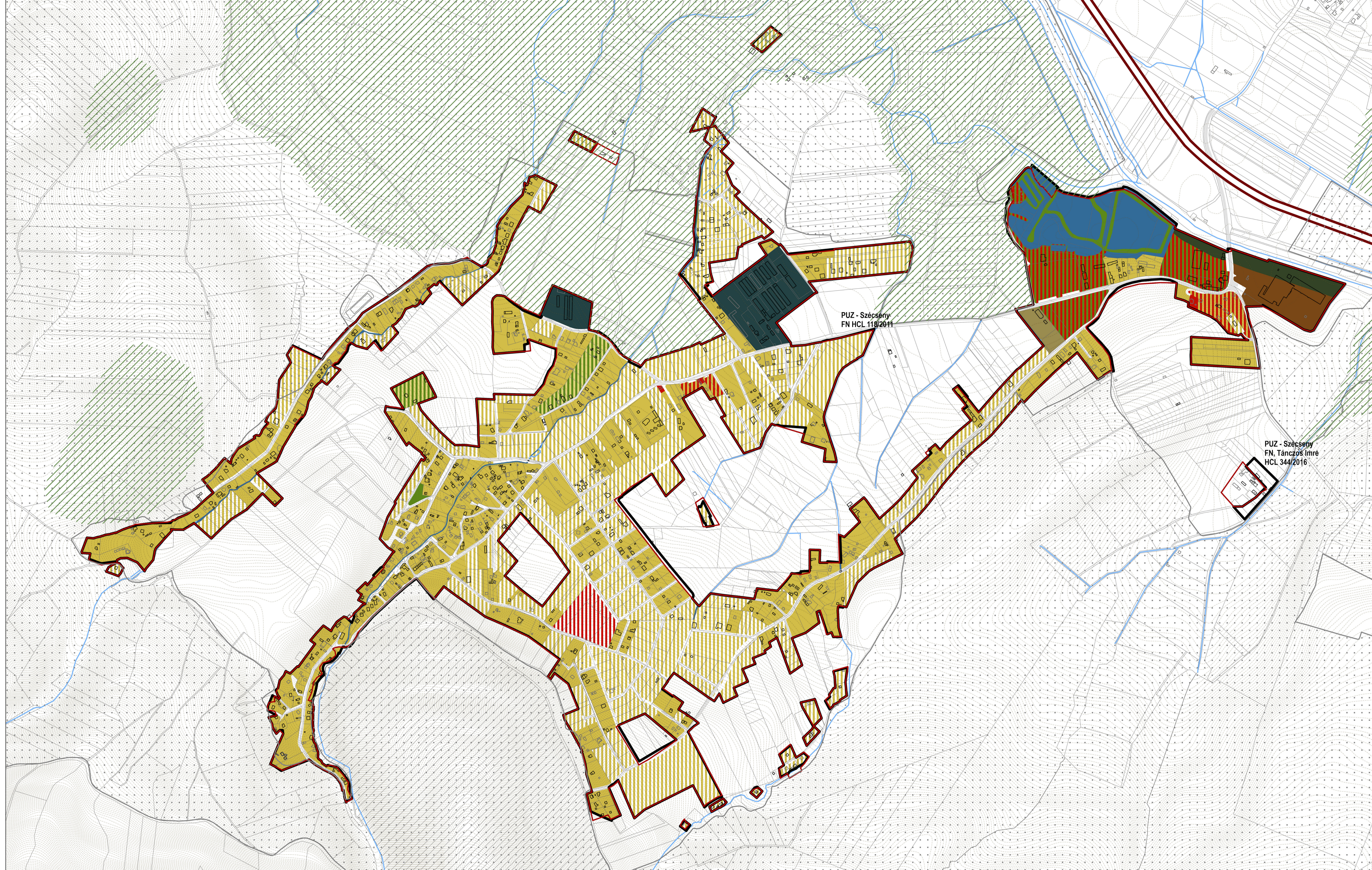
Bilanț teritorial - PUZ Szecseny 2011